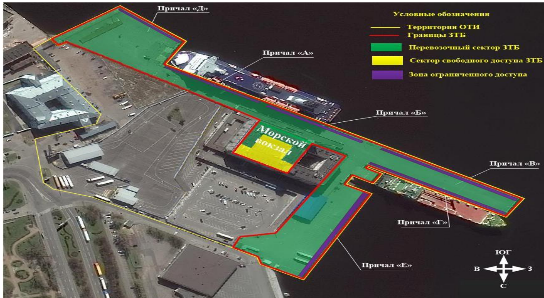
Схема 1. Схема объекта транспортной инфраструктуры и границы зоны транспортной безопасности (сектор свободного доступа, и перевозочный сектор) ОТИ «Морской терминал»