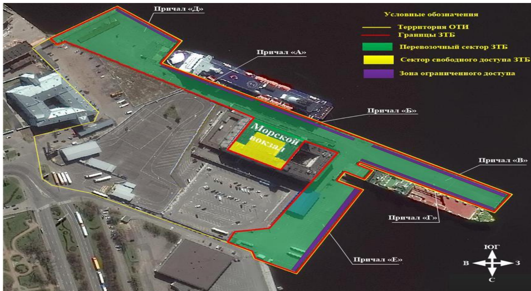
Схема 1. Схема объекта транспортной инфраструктуры и границы зоны транспортной безопасности (сектор свободного доступа, и перевозочный сектор) ОТИ «Морской терминал»